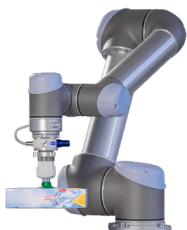
L'effecteur de vide VEE pour la manipulation de petits emballages